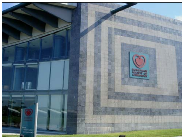
La Maison de Coeur, Sophia Antipolis, France

Grupul de Lucru de Cardiologie de Urgență al Societății Române de Cardiologie consideră această solicitare ca pe o nouă oportunitate de a participa la o inițiativă europeană de anvergură care va oferi informații valoroase referitoare la un subiect care ne preocupă de mult timp.