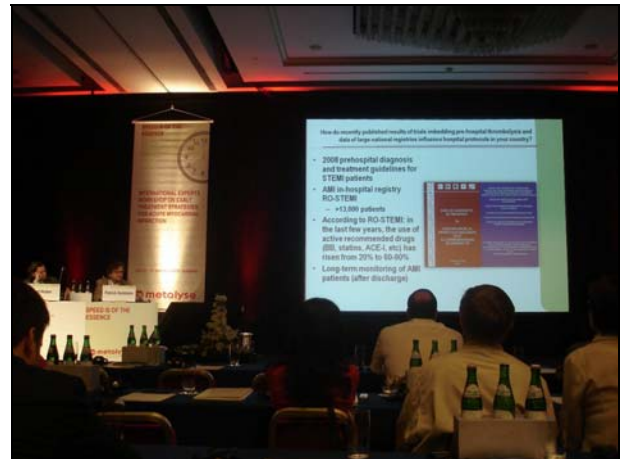
Menționarea progreselor realizate în România referitoare la abordarea STEMI: Registrul Ro-STEMI și Ghidul pre-hospital STEMI (2009)