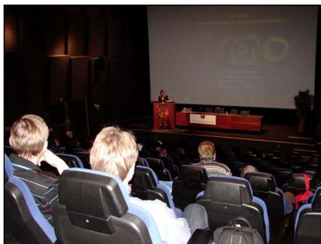
Congresul Nordic-Baltic de Cardiologie: imagine din sala de conferințe.