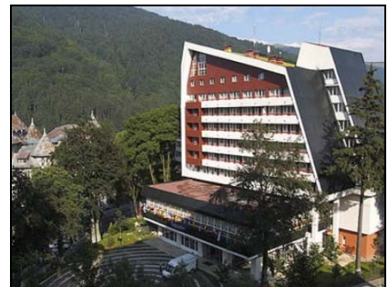
Hotelul Internațional, Sinaia