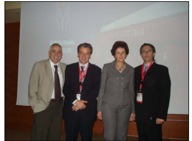
Alăturați-vă nucleului RO-TEP !