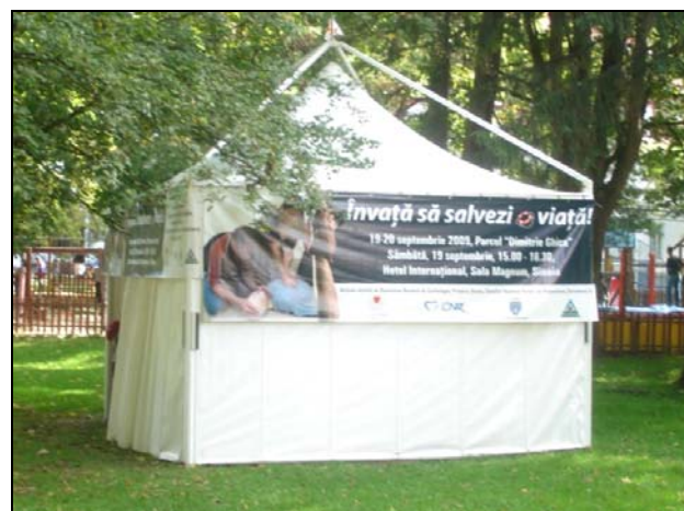
Cortul “Învăț să salvezi o viață!”