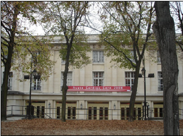
Acute Cardiac Care 2008 la Versailles – Palais des Congrès.

Meeting organised by the ESC Working Group on Acute Cardiac Care