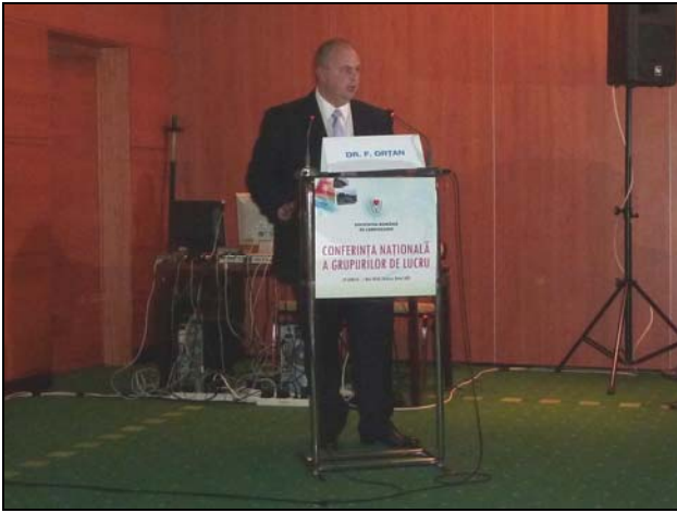
F. Ortan: Reorientări în teritoriul arondat unui centru invaziv de infarct..