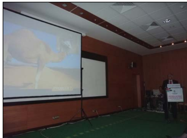
G. Tatu-Chițoiu, A. Petriș: Unitățile coronariene în România 2010 - între realitate și legislație.