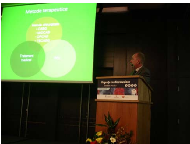
V. Iliescu: Tratamentul chirurgical în urgență; indicații și riscuri.