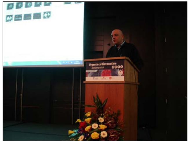
R. Arafat: Definiția urgenței cardiovasculare: timp, severitate, intervenție.