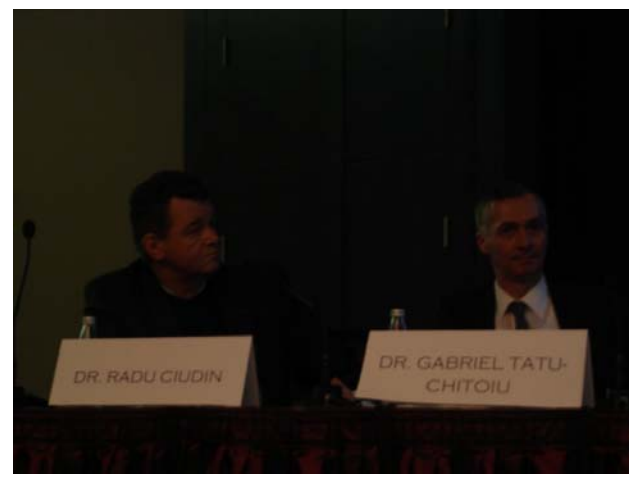
R. Ciudin: Tahicardiile cu complex larg la pacientul cu Insuficiență Cardiacă.