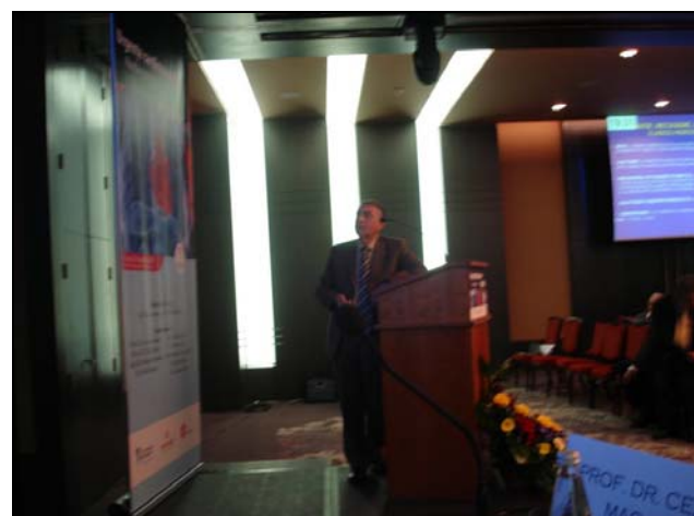
C. Macarie: Edemul pulmonar acut cardiogen; evaluare și management.