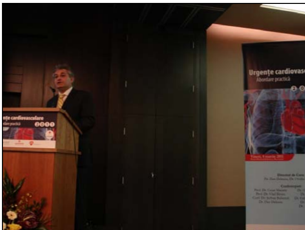
O. Chioncel: Sindromul Coronarian Acut – tratamentul antitrombotic în urgență.