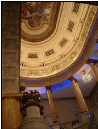
Palatul Regal, București. Treptele către Sala Tronului.