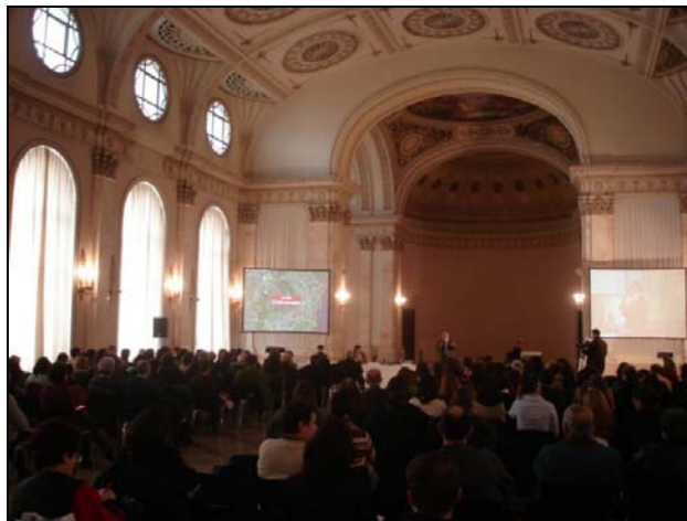
O participare impresionantă: peste 450 de cursanți!