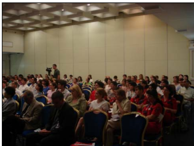
Cursul "Pre-spital STEMI" Iași - 201 participanți.