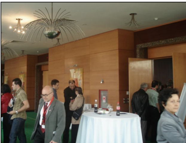
370 de volume distribuite: o sală de conferințe neîncăpătoare.