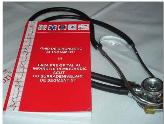
Ghidul de diagnostic și tratament în faza pre-spital al IMA cu supradenivelare de segment ST.