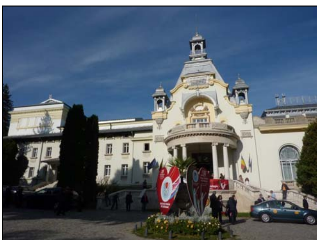
Al 50-lea Congres Național de Cardiologie Sinaia 2011