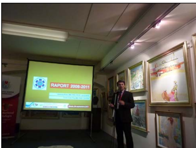
Raportul Președintelui Grupului de Lucru Cardiologie de Urgență 2008-2011