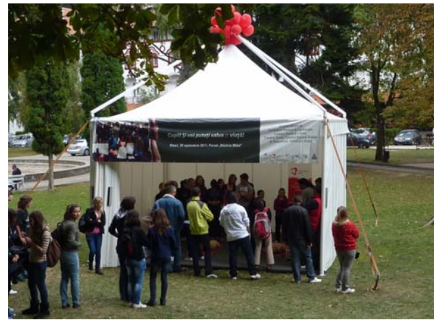
Copii ! Si voi puteți salva o viață !