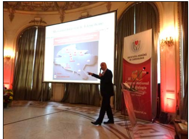
Raed Arafat: Abordarea pre-spital în programul STEMI – prezent și viitor.