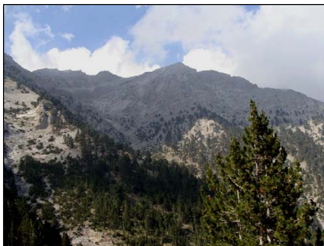
Muntele Olimp, septembrie 2012.