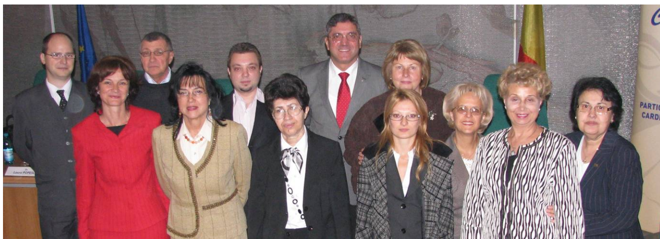
Cursul CardioFem – Craiova. Mai este nevoie de prezentări?