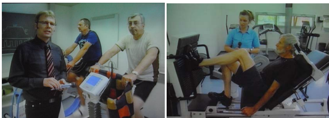
Transmisii live din sălile de antrenament-sesiuni interactive

O parte dintre participanții la acest curs avea să se regăsească în săptămâna următoare la Berna, la tradiționalul curs de recuperare, în acest an tema fiind „Recuperarea pacienților cu insuficiență cardiacă”. Conferințe, sesiuni interactive, transmisii live din sala de antrenament, ateliere practice de testare de efort-toate acestea într-un program desfășurat pe parcursul a 3 zile (27-29 octombrie).