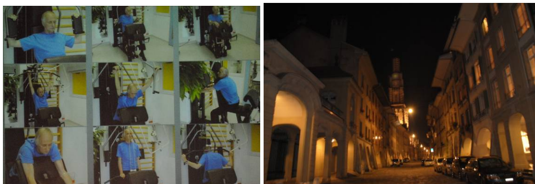
Demonstrații practice la cursul de la Berna; orașul vechi – seara, după o zi plină de curs

Anul viitor, la conferința grupurilor de lucru intenționăm să organizăm atât un curs practic de testare de efort cardiopulmonară, cât și sesiuni interactive/ateliere practice de recuperare în bolile cardiovasculare, cu transmisii în direct de la o clinică din străinătate. Așteptăm opiniile voastre pe aceasta temă, precum și propuneri de cursuri care v-ar interesa.