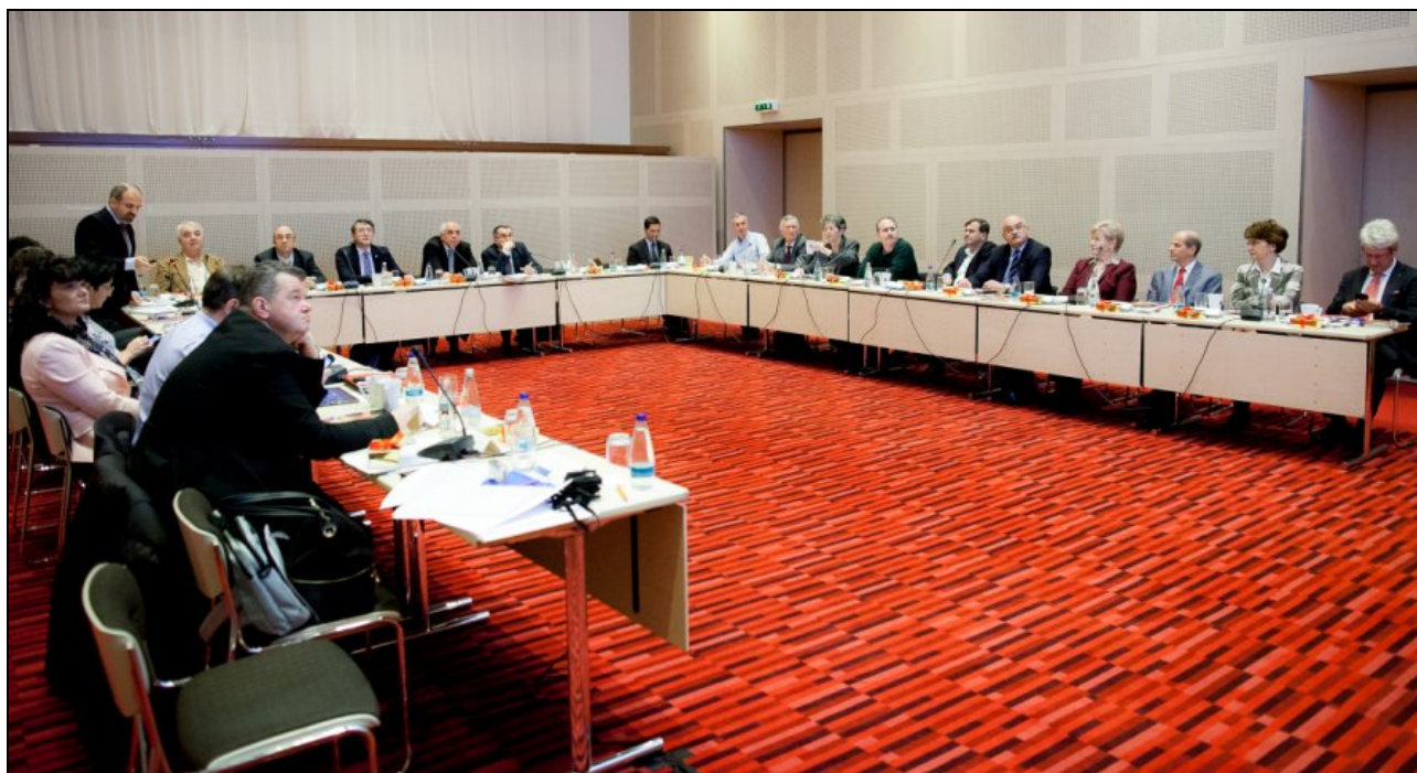
Ședința Board-ului Societății Române de Cardiologie (11 decembrie 2014)

D. CAMPANIE PENTRU CREAREA SUBSPECIALITĂȚII DE CARDIOLOG INTENSIVIST – în cooperare cu Societatea de Anestezie și Terapie Intensivă și Ministerul Sănătății.