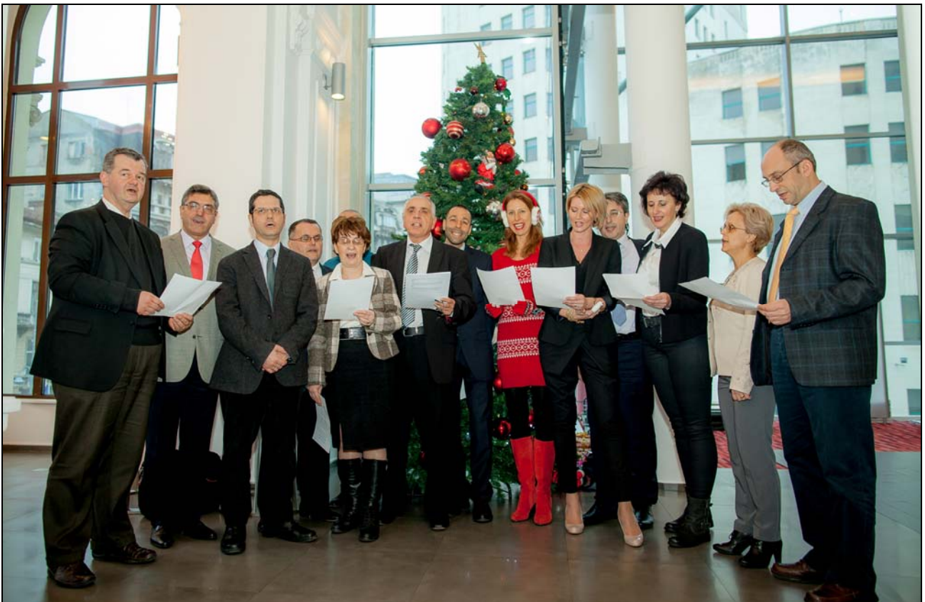
Colindul Athletic CardioClub