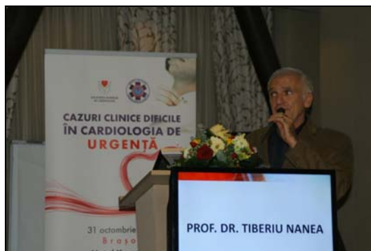
Tiberiu Nanea: Infarct miocardic acut cu artere coronare normale.