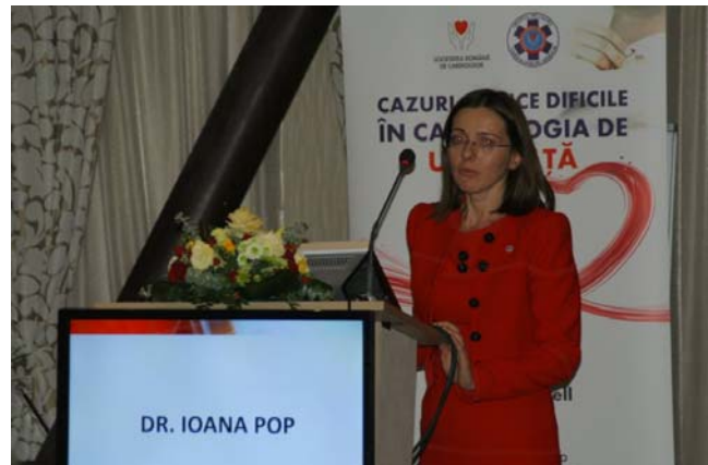
Ioana Pop: Sindrom coronarian acut...sau nu ?