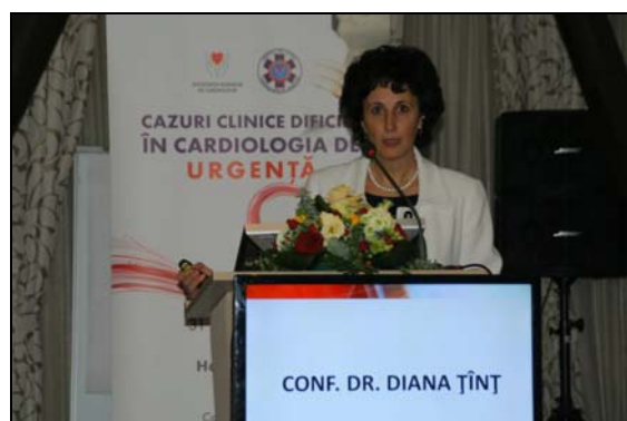
Diana Țiț: Supradenivelare de segment ST, cum abordăm - I?