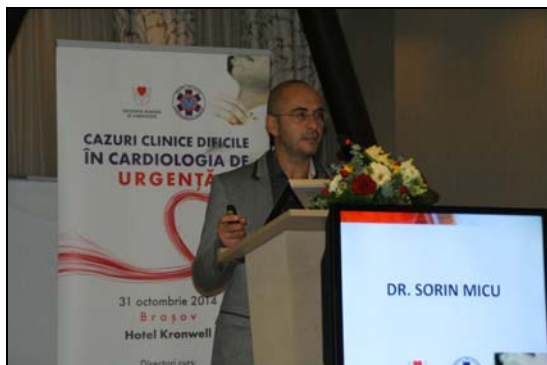
Sorin Micu: Super responder la terapia de resincronizare cardiacă: foaie de parcurs.