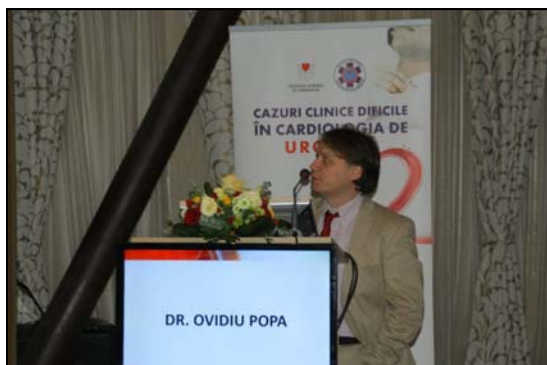
Ovidiu Popa, Diana Cimpoeșu: Șoc anafilactic de cauză rară.