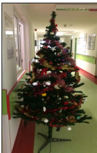
Brad – Clinica de Cardiologie Baia Mare