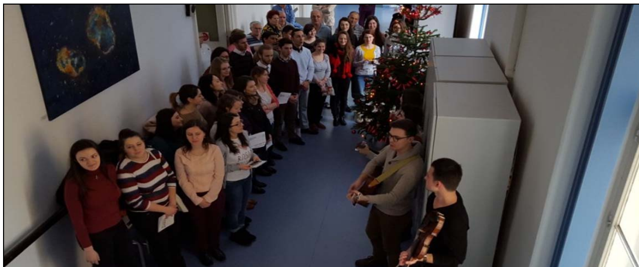
Clinica de Cardiologie "Spitalul Clinic Județean de Urgență "Sf. Spiridon" Iași: colind al "Cetei de mediciști"