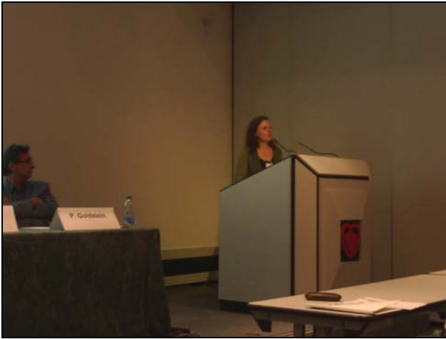
Maaret CASTREN (președinte ERC)