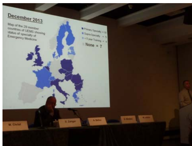
Harta țărilor UE în care există specialitatea “medicină de urgență” (situația din decembrie 2013).