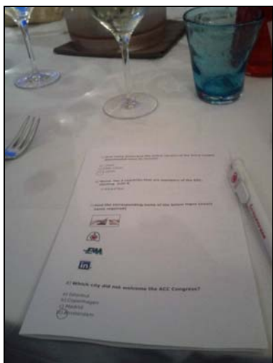
Quiz referitor la ACCA în cursul dineului ...