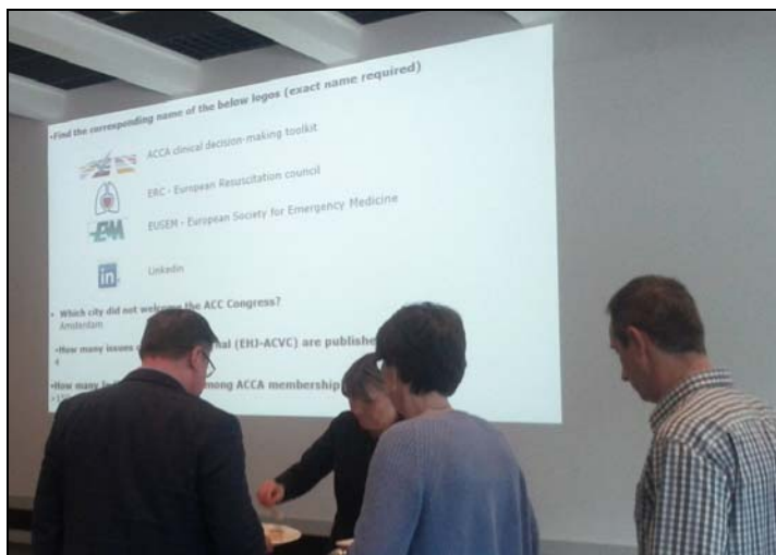
și răspunsul la Quiz a doua zi, în cursul mesei de prânz ...